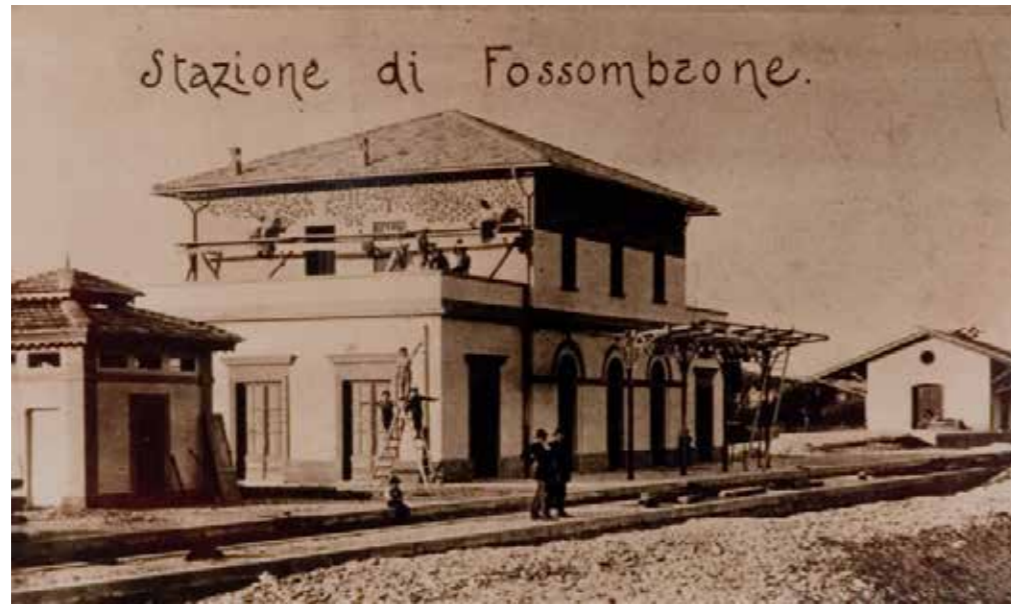
Fossombrone stazione '900