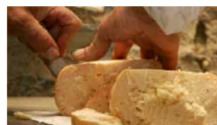
Formaggio di Fossa