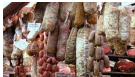
Salame del Montefeltro