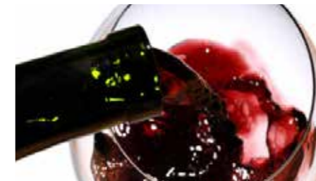
Vino di Visciole