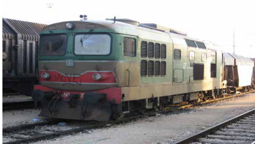
Locomotiva FS D.343