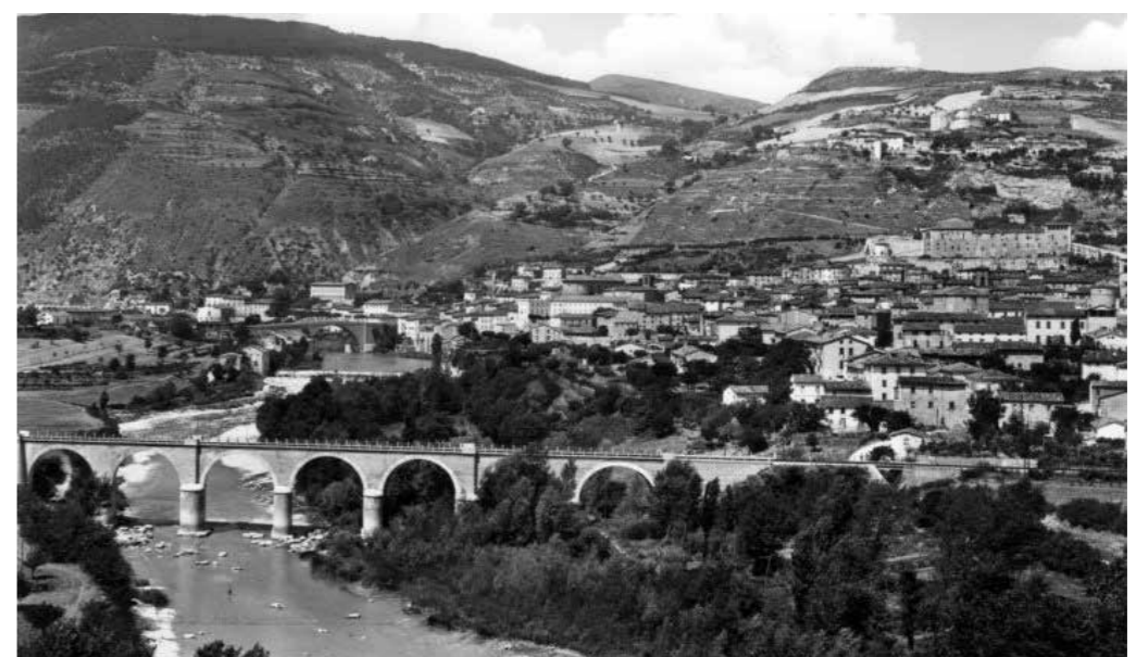
Fossombrone stazione '900