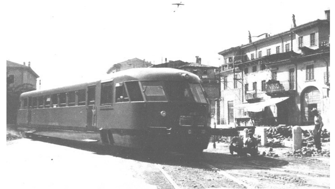
Automotrice ALn 556