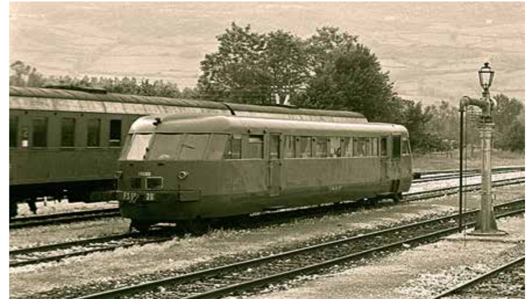
Automotrice ALn 56