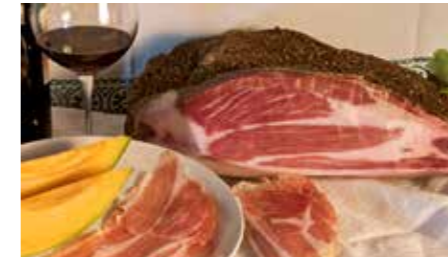
Prosciutto del Montefeltro