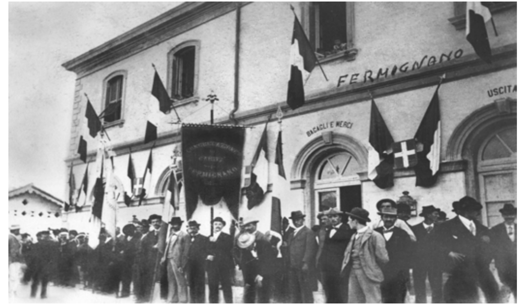
Fermignano inaugurazione stazione stazione -20 Settembre 1898