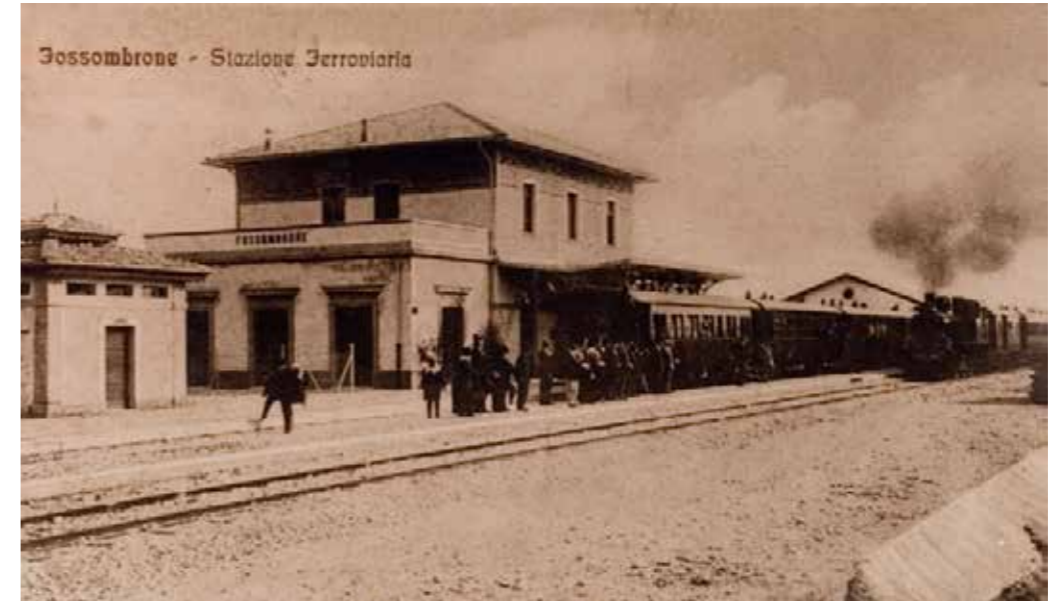
Fossombrone stazione '900