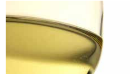
Bianchetto del Metauro