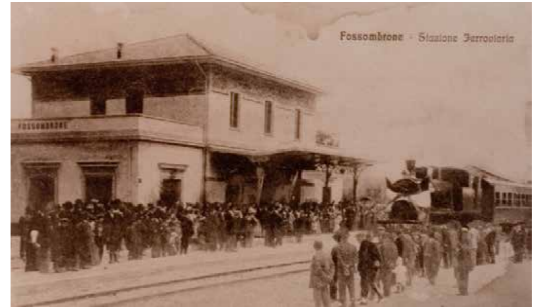
Fossombrone stazione '900