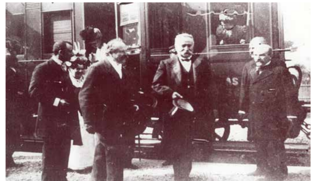
Fermignano inaugurazione stazione stazione -20 Settembre 1898