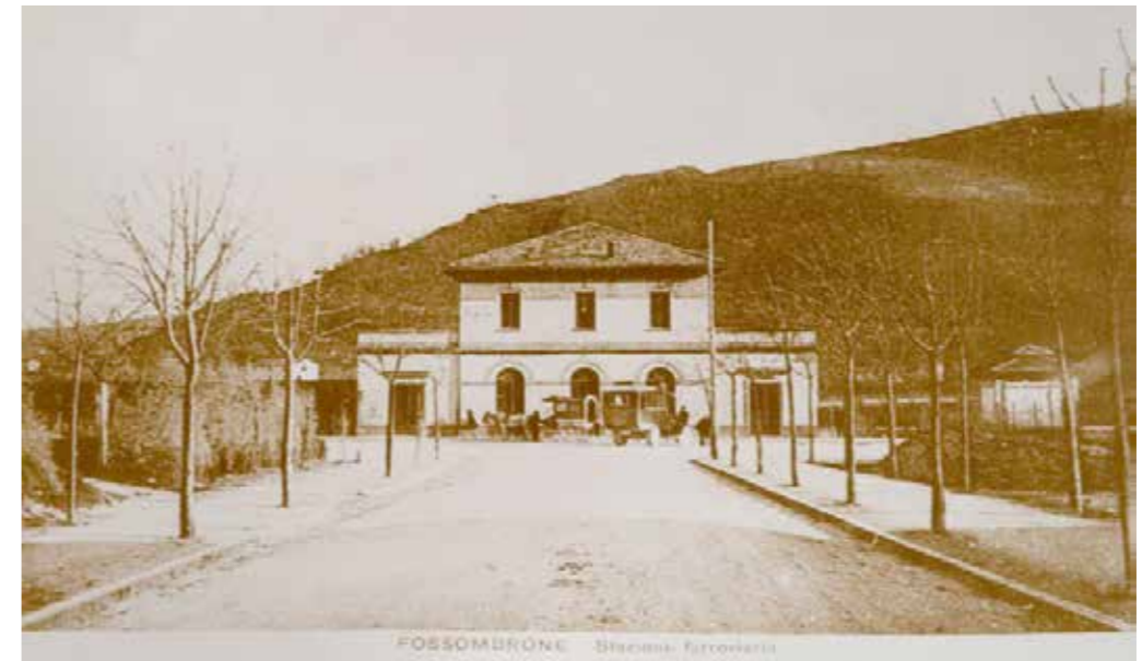
Fossombrone stazione '900