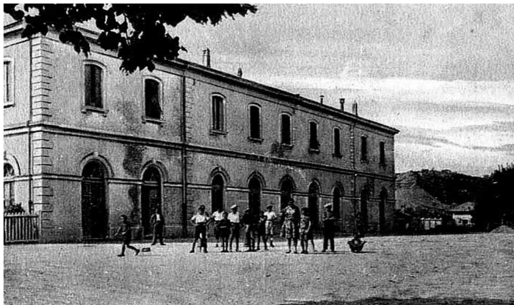
Fermignano stazione '900