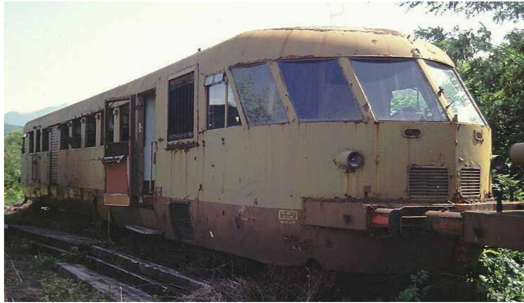
Automotrice ALDn 32