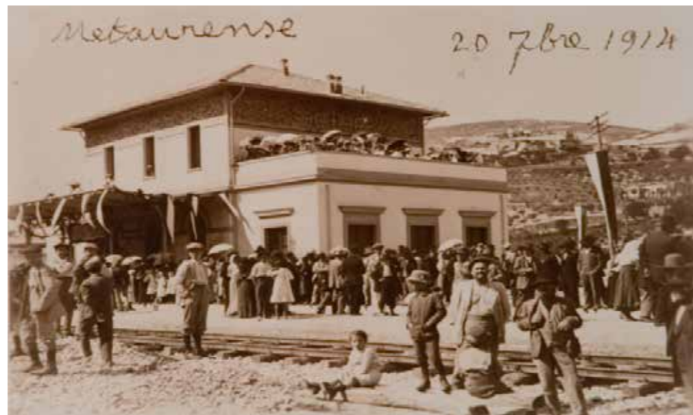
Fossombrone stazione '900