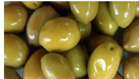
Olive - Olio