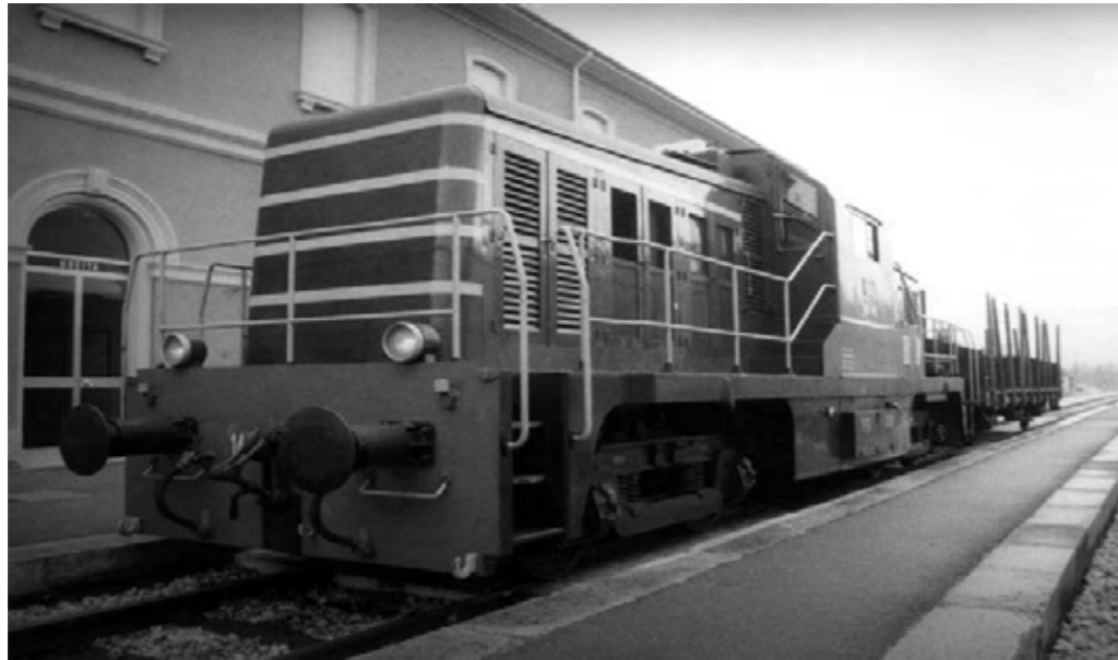
Fermignano stazione '900