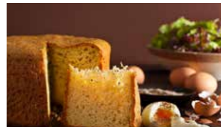
Crescia di pasqua